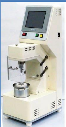
自動硬化時間測定裝置 “MADOKA”

自動硬化時間測定裝置 (MADOKA)：除日本國內以外，也積極的拓展至海外(台灣、韓國)市場。