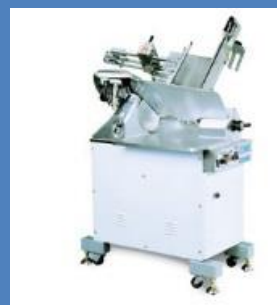
冷凍・生肉切片機