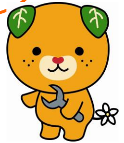
愛媛県イメージアップキャラクター「みきゃん」