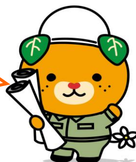
愛媛県イメージアップキャラクター「みきゃん」